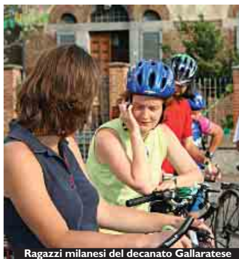
Ragazzi milanesi del decanato Gallaratese